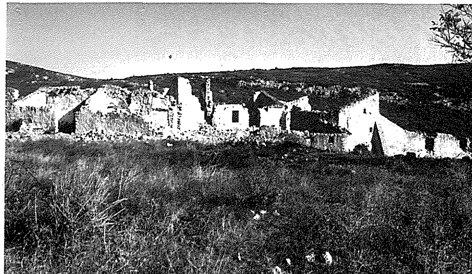
Mas de Mata-rodonà